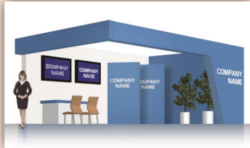
Gian hàng đắt trổng (tự thiết kế - dàn dựng) (giá niêm yết: 34,500,000VND/gian)