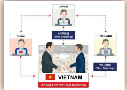
Gói triển lãm online (giá niêm yết: 25,500,000VND/DN)

Nhiều ưu đãi cho doanh nghiệp đăng ký sớm!