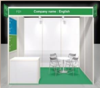
Gian hàng tiêu chuẩn (giá niêm yết: 38,500,000VND/gian)